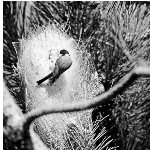
Mésange se nourrissant de chenilles processionnaires

Si vous me rencontrez lors de ma procession, ne me touchez surtout pas car je provoque d'importantes voire de graves réactions allergiques : démangeaisons, œdèmes (au niveau des mains, du cou, du visage) mais aussi des troubles oculaires ou respiratoires. Il est aussi dangereux de manipuler mon nid même vide car il est rempli de mes poils. Je suis très dangereuse pour les animaux domestiques, notamment les chiens qui peuvent lécher les démangeaisons sur leur corps et risque dès lors la nécrose de la langue voire la mort s'ils ne sont pas traités rapidement. Si vous souhaitez lutter contre ma présence, il vous reste à enlever (en vous protégeant) et détruire mon nid en l'incinérant ; ou encore poser un « éco-piège » (1) (création de La Mésange Verte) sur les arbres que je colonise.